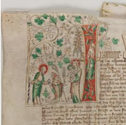
Medienbild Ausstellung Basler Münster 7